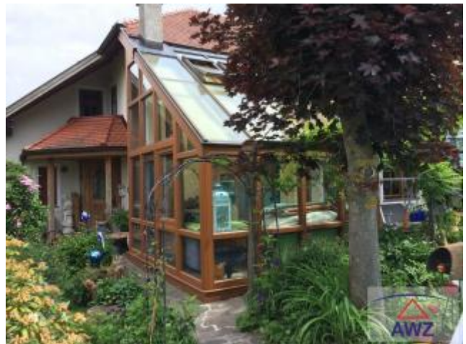
Terrasse zum Pool