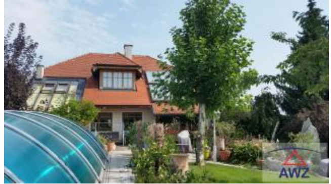
Terrasse mit Pool